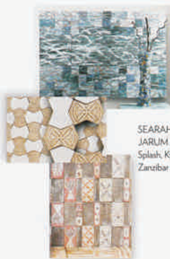
SEARAH JARUM JAM Splash, Kyte, Zanzibar

Segera miliki seri tile terbaru dari duo seniman Philip dan Graham untuk Venus Tiles. Desain yang memiliki cita rasa seni tinggi ini terinspirasi dari budaya, alam hingga lingkungan. Tekstur alami seperti Splash dan Sea merupakan pola warna-warni biru yang membentuk seperti bentuk ombak, buih, dan deburan air. Terdapat juga motif yang terinspirasi dari budaya berbagai negara, seperti Zanzibar yang merupakan motif dari suku primitif Afrika. Ataupun seri Rajasthan yang mendapat pengaruh dari ukiran kayu di India. Livingetc sangat menyukai seri Kyte yang terinspirasi dari layang-layang seorang anak kecil dan potongan abjad dalam keramik dalam koleksi Text . (venus-tiles.com)